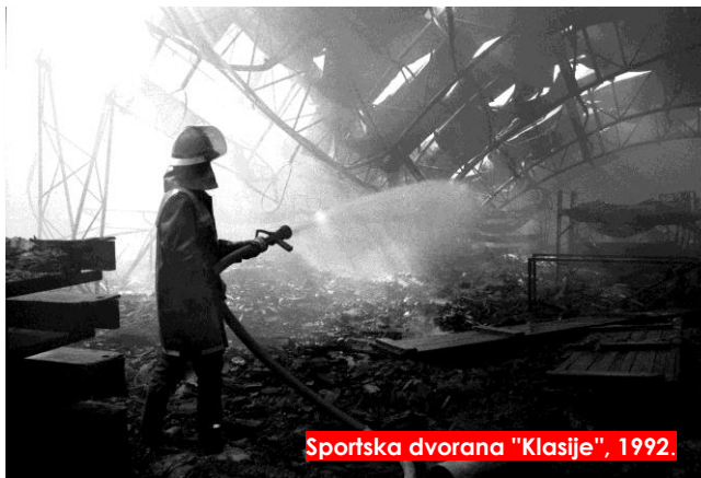
Sportska dvorana "Klasije", 1992.

Rat je najgore što se jednoj generaciji može dogoditi; stoga je osnovna pouka za sve nas shvatiti veličinu tog zla i važnost mira i da to saznanje prenesemo na buduću generaciju. Nemojmo zaboraviti da je mržnja osnovno sjeme zla, a potreba za osvetom je tek korak do mržnje.