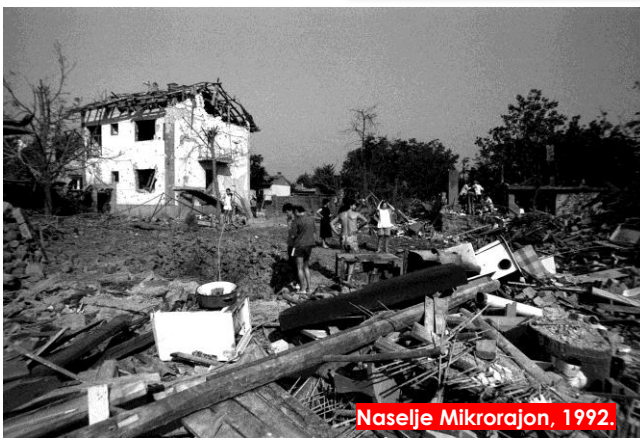
Naselje Mikrorajon, 1992.